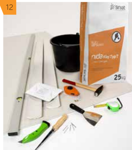
12 Гарантируем получение высокого качества отделки в случае применения элементов системы NIDA.