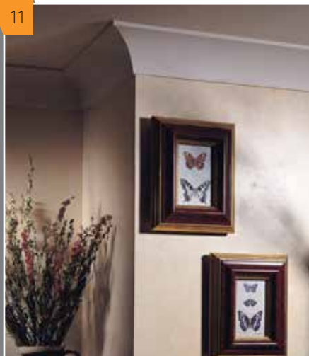
11 Углы, отделанные с помощью карнизов, увеличивают эстетику помещения.