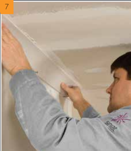
7 Прикладываем карниз с клеем, опирая его на гвоздях, определяющих уровень.