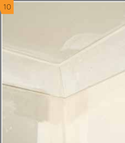
10 После высыхания клея вытягиваем гвозди поддерживающие карнизы.