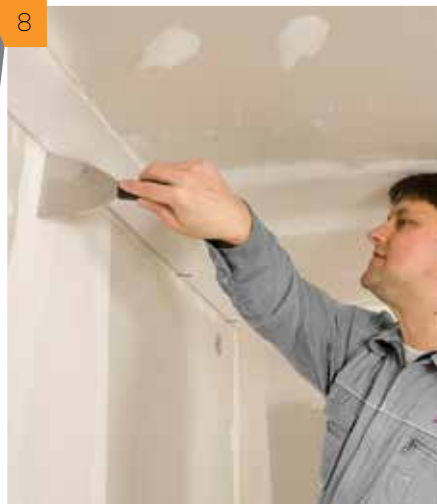
8 Излишек вытекающего клея удаляем с помощью шпателя.