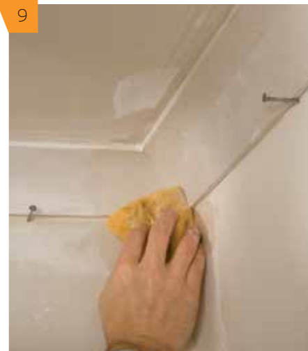
9 Влажной губкой протираем верхние и нижние кромки карниза, чтобы удалить все остатки клея.